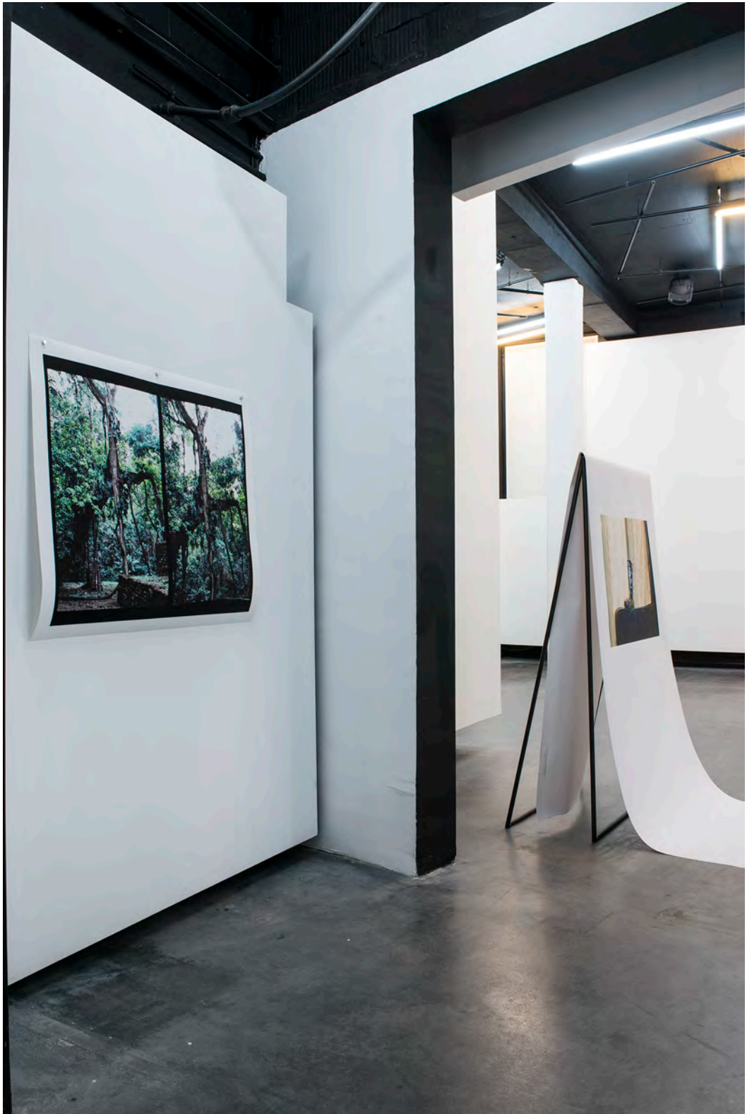
»Wandernde Sichtachsen nach Usumacinta«, 2015 Installation Shot Galerie Parrotta Contemporary Art